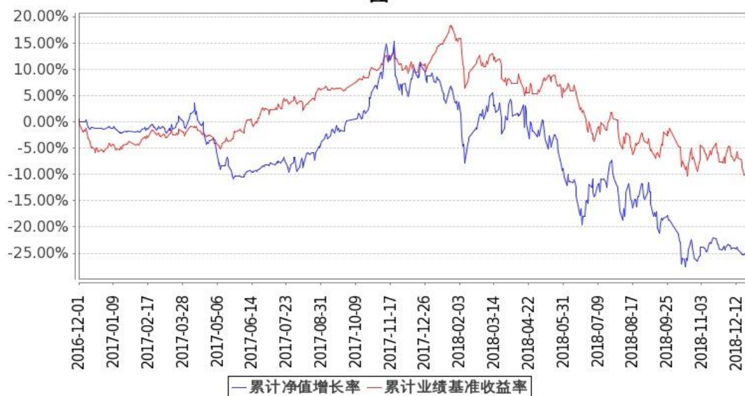
图：嘉实优势成长混合基金份额累计净值增长率与同期业绩比较基准收益率的历史走势对比图 (2016年12月1日至2018年12月31日)

注：按基金合同和招募说明书的约定，本基金自基金合同生效日起6个月内为建仓期，建仓期结束时本基金的各项投资比例符合基金合同（十二（二）投资范围和（四）投资限制）的有关约定。