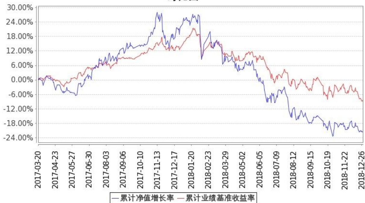
图：嘉实丰和灵活配置混合基金份额累计净值增长率与同期业绩比较基准收益率的历史走势对比图