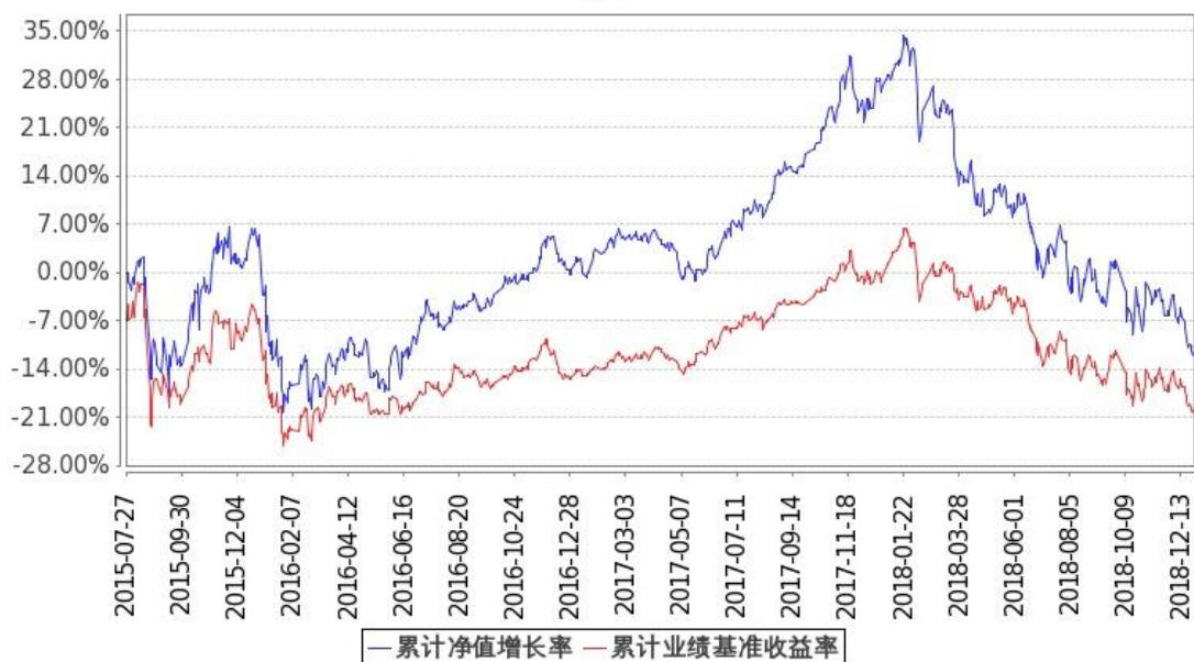
图：嘉实低价策略股票基金份额累计净值增长率与同期业绩比较基准收益率的历史走势对比图 (2015年7月27日至2018年12月31日)

注：按基金合同和招募说明书的约定，本基金自基金合同生效日起6个月内为建仓期，建仓期结束时本基金的各项投资比例符合基金合同（十二（二）投资范围和（四）投资限制）的有关约定。