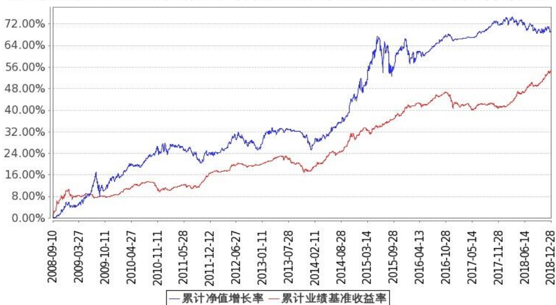
图 2: 嘉实多元债券 B 基金份额累计净值增长率与同期业绩比较基准收益率的历史走势对比图