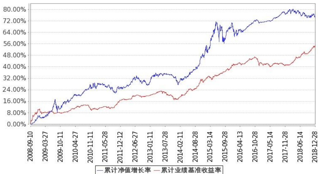
图 1: 嘉实多元债券 A 基金份额累计净值增长率与同期业绩比较基准收益率的历史走势对比图