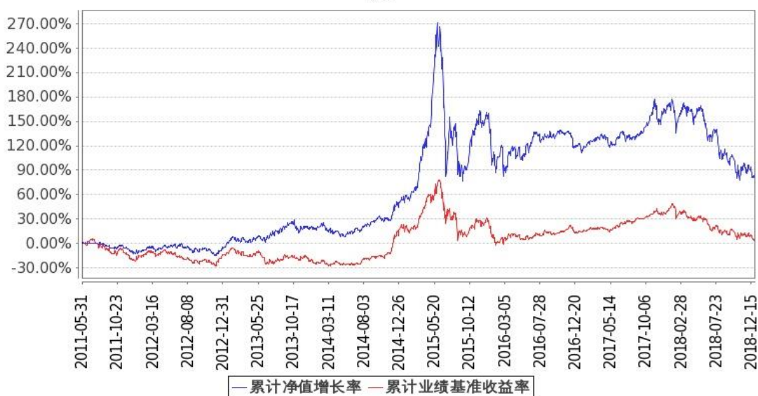
图：嘉实领先成长混合基金份额累计净值增长率与同期业绩比较基准收益率的历史走势对比图 (2011年5月31日至2018年12月31日)

注：按基金合同和招募说明书的约定，本基金自基金合同生效日起6个月内为建仓期，建仓期结束时本基金的各项投资比例符合基金合同“十二、基金的投资（三）投资范围和（七）投资限制”的有关约定。