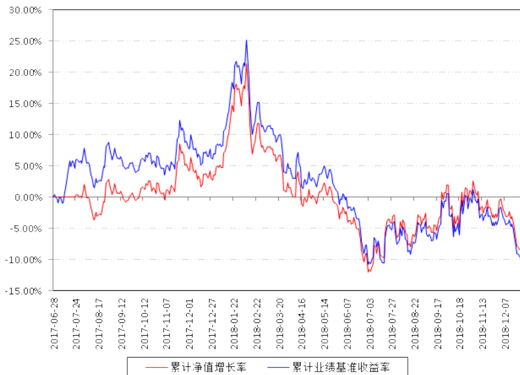
南方中证银行ETF累计净值增长率与同期业绩比较基准收益率的历史走势对比图