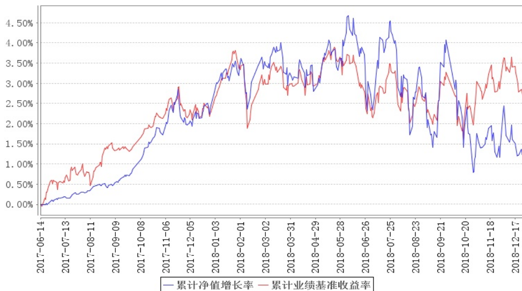
南方安康混合累计净值增长率与同期业绩比较基准收益率的历史走势对比图