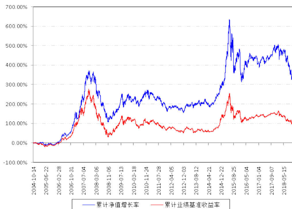
南方积极配置混合(LOF)累计净值增长率与同期业绩比较基准收益率的历史走势对比图