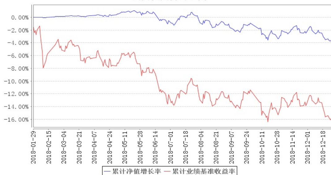
南方融尚再融资主题精选灵活配置混合累计净值增长率与同期业绩比较基准收益率的历史走势对比图

注:本基金合同于 2018 年 1 月 29 日生效,截至本报告期末基金成立未满一年;自基金成立日起 6 个月内为建仓期,建仓期结束时各项资产配置比例符合合同约定。