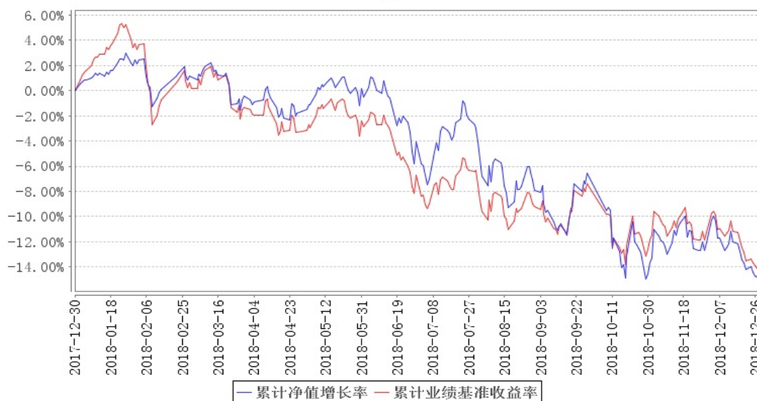
南方瑞利灵活配置混合累计净值增长率与同期业绩比较基准收益率的历史走势对比图