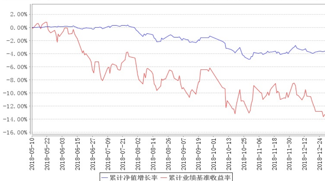
南方瑞祥一年混合A累计净值增长率与同期业绩比较基准收益率的历史走势对比图