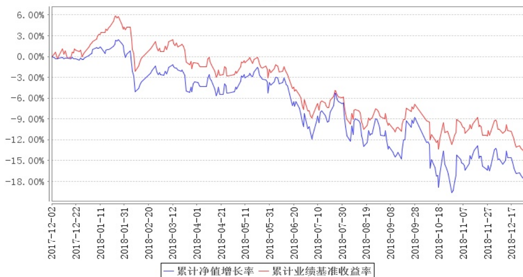
南方顺康灵活配置混合累计净值增长率与同期业绩比较基准收益率的历史走势对比图

注:本基金于 2017 年 12 月 2 日由原南方顺康保本混合型证券投资基金转型为南方顺康灵活配置混合型证券投资基金。本基金建仓期为 6 个月, 建仓期结束时各项资产配置比例符合合同约定。