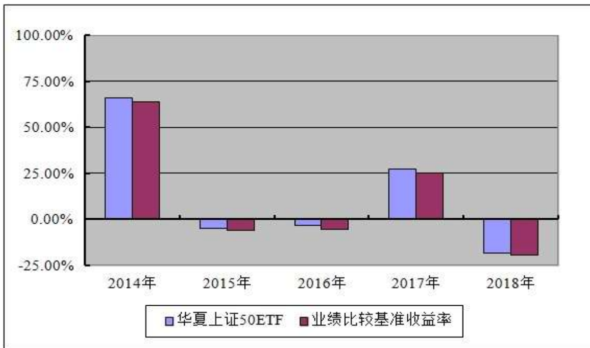
基金每年净值增长率及其与同期业绩比较基准收益率的对比图