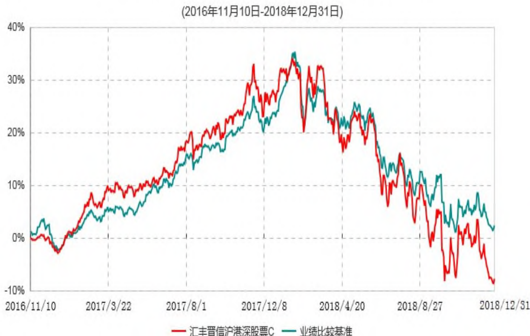
汇丰晋信沪港深股票C累计净值增长率与业绩比较基准收益率历史走势对比图

注：1. 按照基金合同的约定，本基金的投资组合比例为：基金的投资组合比例为：股票资产占基金资产的 80%–95%（投资于港股通标的股票的比例占基金资产的 0–95%），投资于权证的比例为基金资产净值的 0–3%，现金或者到期日在一年以内的政府债券不低于基金资产净值 5%，其中，现金不包括结算备付金、存出保证金、应收申购款等。本基金依据法律法规的规定，本着谨慎和风险可控的原则，可参与创业板上市证券的投资。