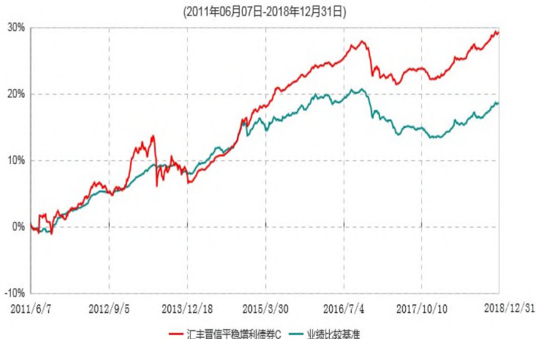
汇丰晋信平稳增利债券C累计净值增长率与业绩比较基准收益率历史走势对比图

注：1. 按照基金合同的约定，本基金主要投资于具有较高息票率的债券品种，包括国债、企业债、公司债、短期融资券、资产支持证券(含资产收益计划)、可转换债券等，投资比例不低于基金资产的 80%，现金或者到期日在一年以内的政府债券不低于基金资产净值的 5%，现金不包括结算备付金、存出保证金、应收申购款等。