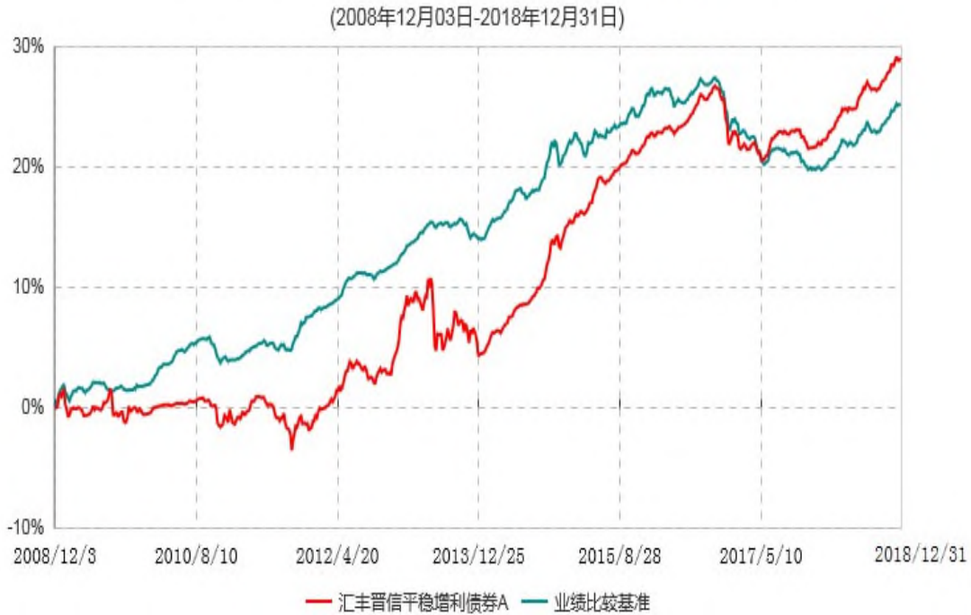
汇丰晋信平稳增利债券A累计净值增长率与业绩比较基准收益率历史走势对比图