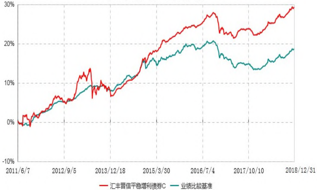
汇丰晋信平稳增利债券C累计净值增长率与业绩比较基准收益率历史走势对比图 (2011年06月07日-2018年12月31日)