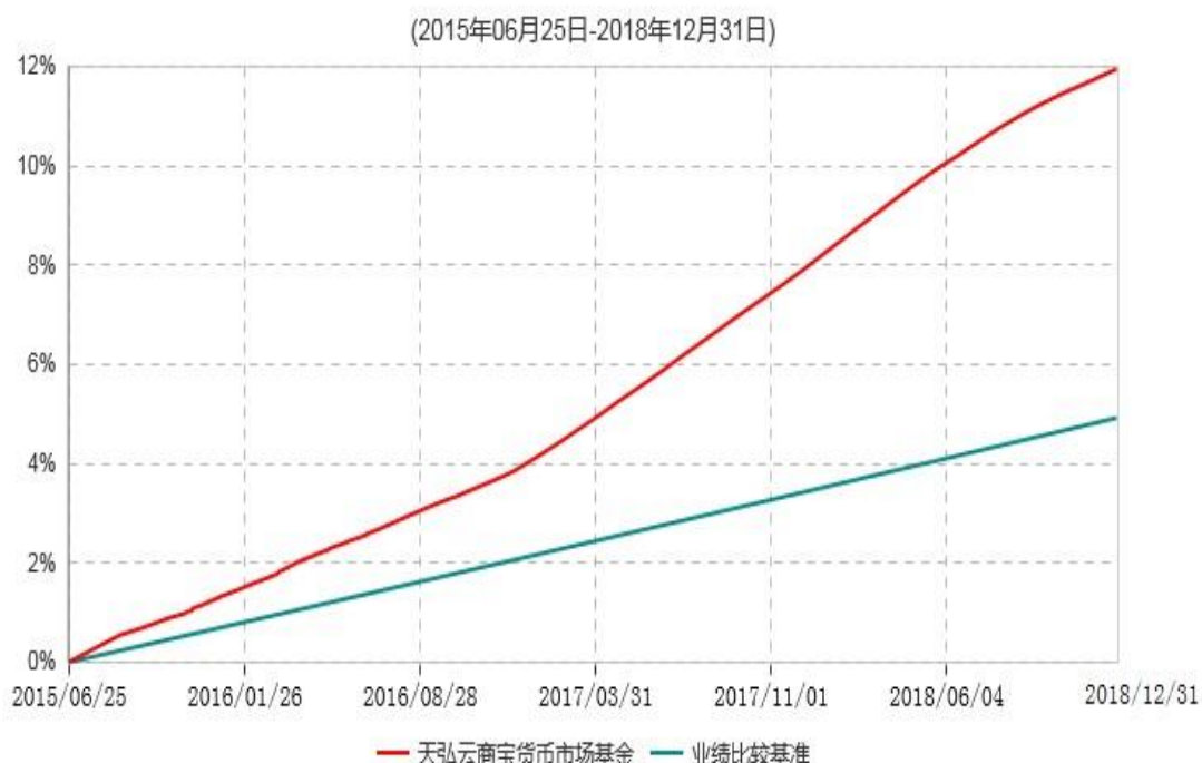
天弘云商宝货币市场基金累计净值收益率与业绩比较基准收益率历史走势对比图

注：1、本基金合同于2015年06月25日生效。 2、本报告期内，本基金的各项投资比例达到基金合同约定的各项比例要求。