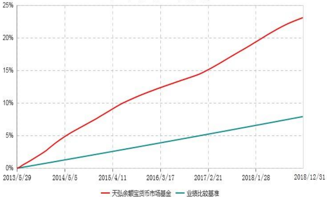
天弘余额宝货币市场基金累计净值收益率与业绩比较基准收益率历史走势对比图 (2013年05月29日-2018年12月31日)

注：1、本基金合同于2013年05月29日生效。 2、本报告期内，本基金的各项投资比例达到基金合同约定的各项比例要求。