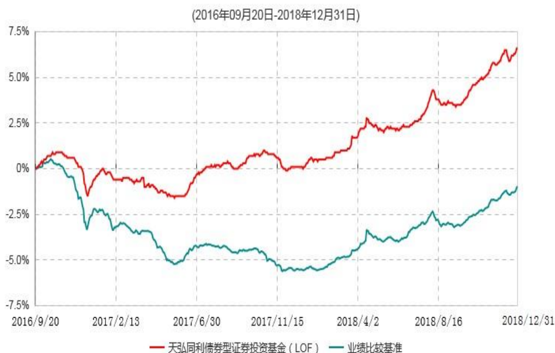
天弘同利债券型证券投资基金（LOF）累计净值增长率与业绩比较基准收益率历史走势对比图

注：1、本基金合同于2013年09月17日生效。根据基金合同约定，本基金于2016年09月19日自动转换为上市开放式基金（LOF），基金名称变更为“天弘同利债券型证券投资基金（LOF）”。