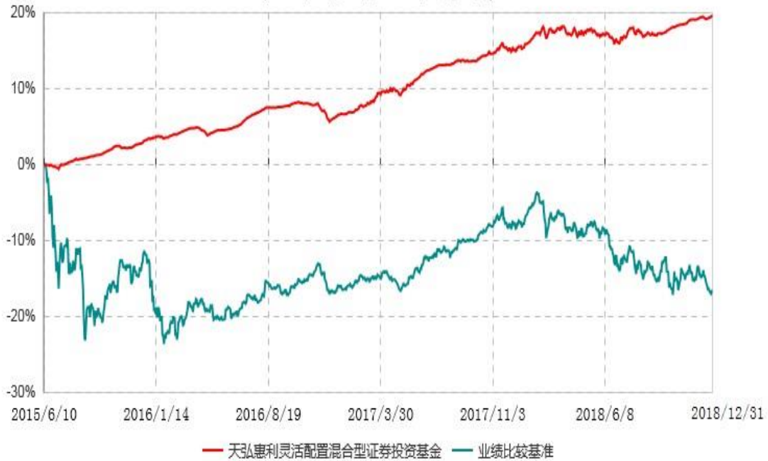
天弘惠利灵活配置混合型证券投资基金累计净值增长率与业绩比较基准收益率历史走势对比图 (2015年06月10日-2018年12月31日)