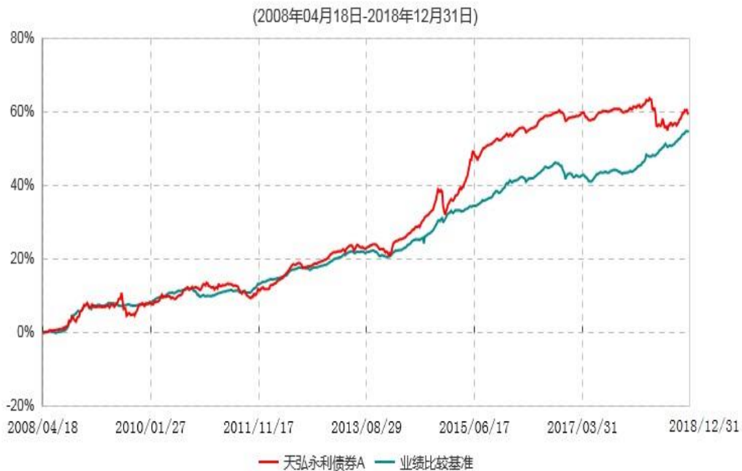
天弘永利债券A累计净值增长率与业绩比较基准收益率历史走势对比图