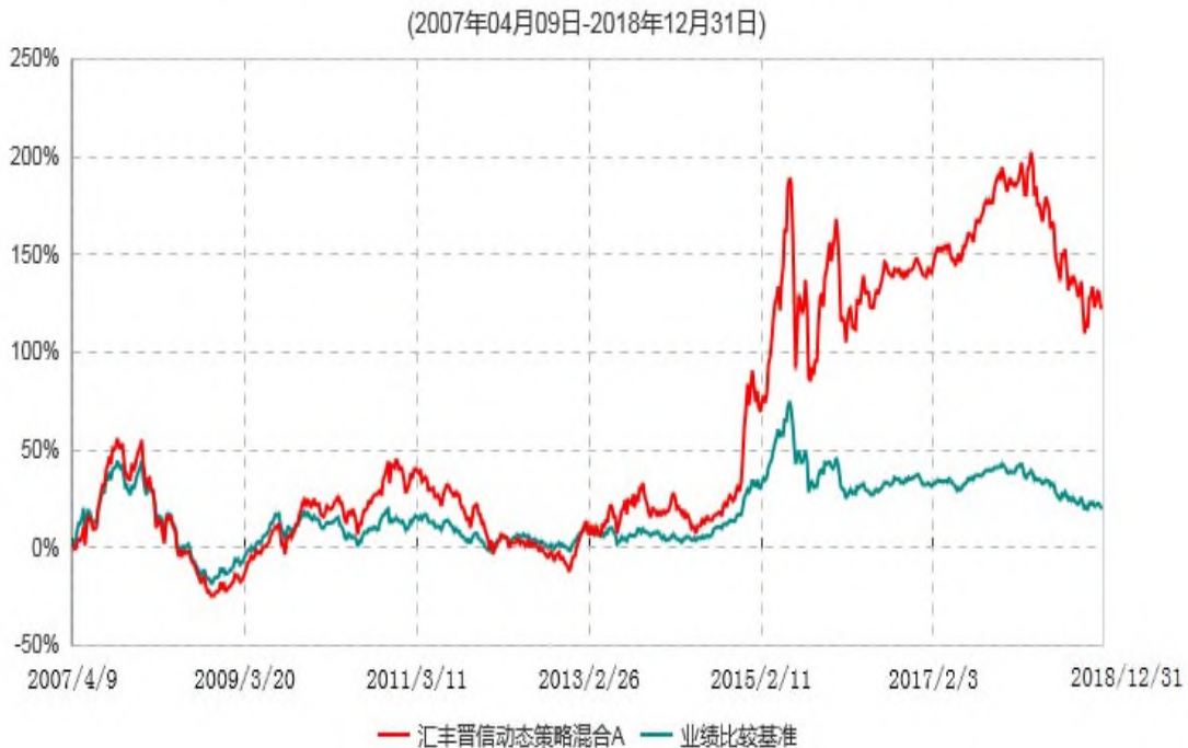
汇丰晋信动态策略混合A累计净值增长率与业绩比较基准收益率历史走势对比图

注： 1. 按照基金合同的约定，本基金的投资组合比例为：股票占基金资产的 30%-95%；除股票以外的其他资产占基金资产的 5%-70%，其中现金（不包括结算备付金、存出保证金、应收申购款等）或到期日在一年期以内的政府债券的比例合计不低于基金资产净值的 5%。本基金自基金合同生效日起不超过六个月内完成建仓。截止 2007 年 10 月 9 日，本基金的各项投资比例已达到基金合同约定的比例。 2. 基金合同生效日（2007 年 4 月 9 日）至 2014 年 5 月 31 日，本基金的业绩比较基准为“50%×MSCI 中国 A 股在岸指数收益率+50%×中信标普全债指数收益率”。自 2014 年 6 月 1 日起，本基金的业绩比较基准调整为“50%×MSCI 中国 A 股在岸指数收益率+50%×中债新综合指数收益率（全价）”。MSCI 中国 A 股在岸指数成份股在报告期产生的股票红利收益已计入指数收益率的计算中。 3. 自 2018 年 3 月 1 日起，MSCI 中国 A 股指数更名为 MSCI 中国 A 股在岸指数。