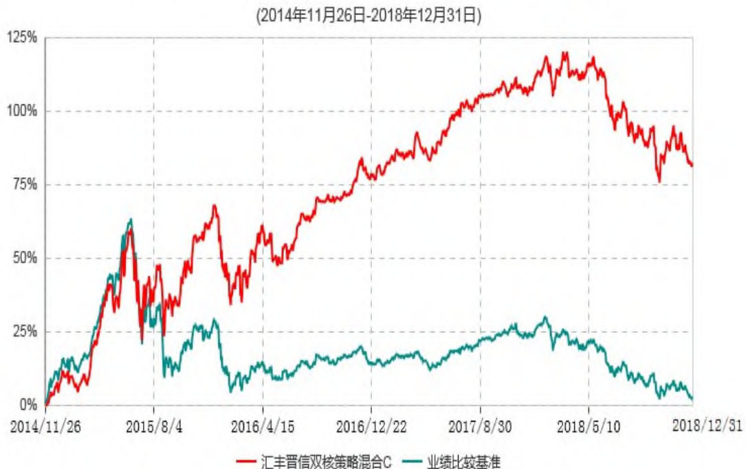
汇丰晋信双核策略混合C累计净值增长率与业绩比较基准收益率历史走势对比图

3. 上述基金净值增长率的计算已包含本基金所投资股票在报告期产生的股票红利收益。同期业绩比较基准收益率的计算未包含中证 800 指数成份股在报告期产生的股票红利收益。