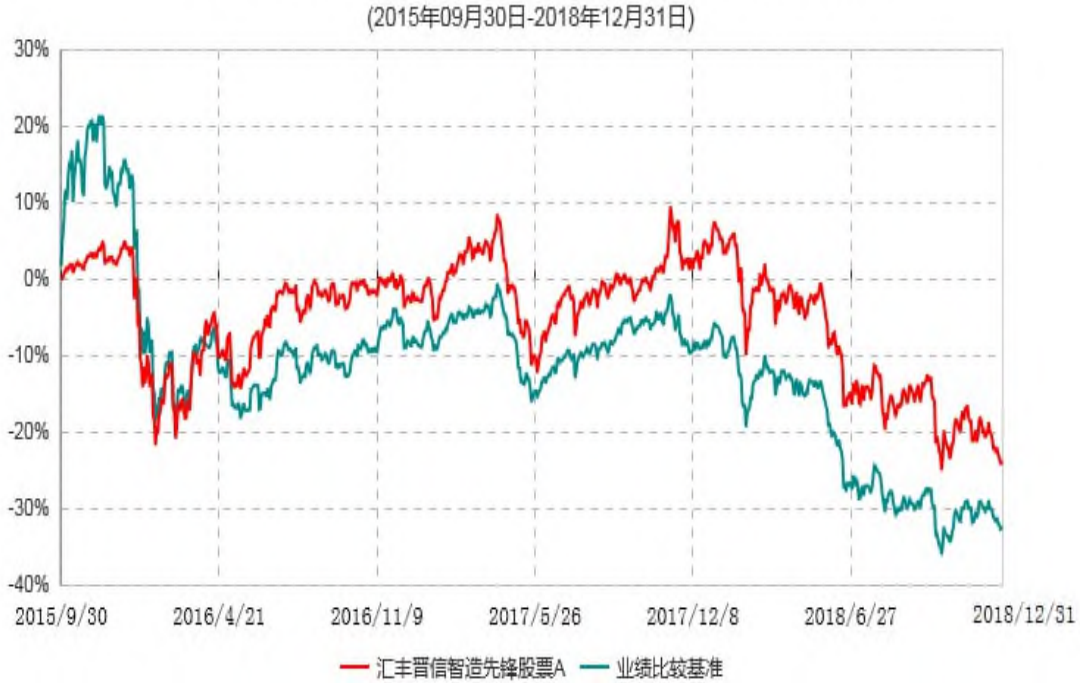
汇丰晋信智造先锋股票A累计净值增长率与业绩比较基准收益率历史走势对比图