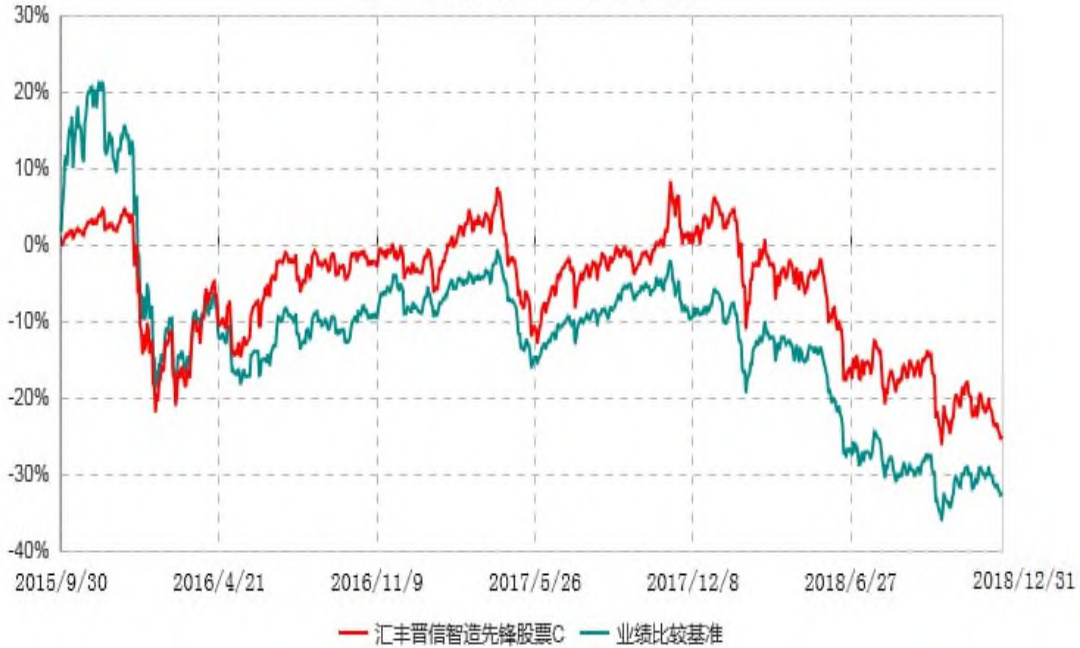
汇丰晋信智造先锋股票C累计净值增长率与业绩比较基准收益率历史走势对比图 (2015年09月30日-2018年12月31日)