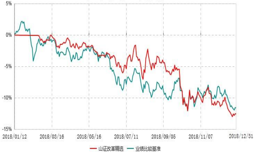
山西证券改革精选灵活配置混合型证券投资基金累计净值增长率与业绩比较基准收益率历史走势对比图 (2018年01月12日-2018年12月31日)

注：1、本基金基金合同生效日为2018年1月12日，至本报告期末，本基金运作时间未 满一年；