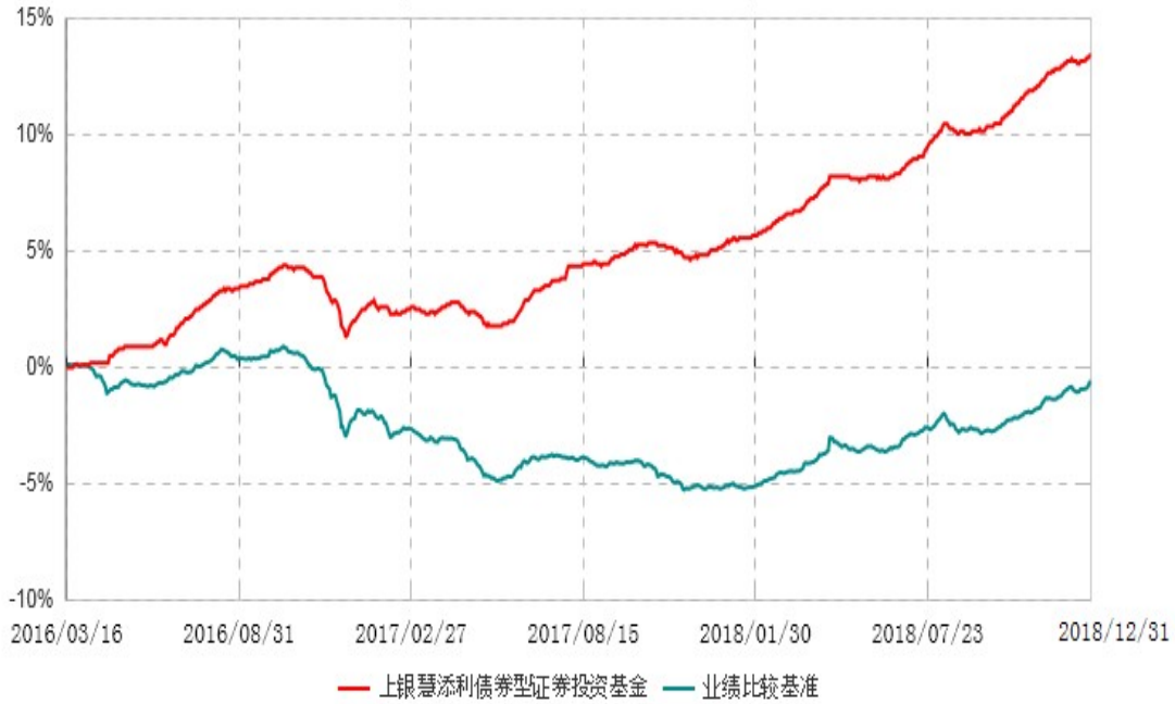
上银慧添利债券型证券投资基金累计净值增长率与业绩比较基准收益率历史走势对比图 (2016年03月16日-2018年12月31日)