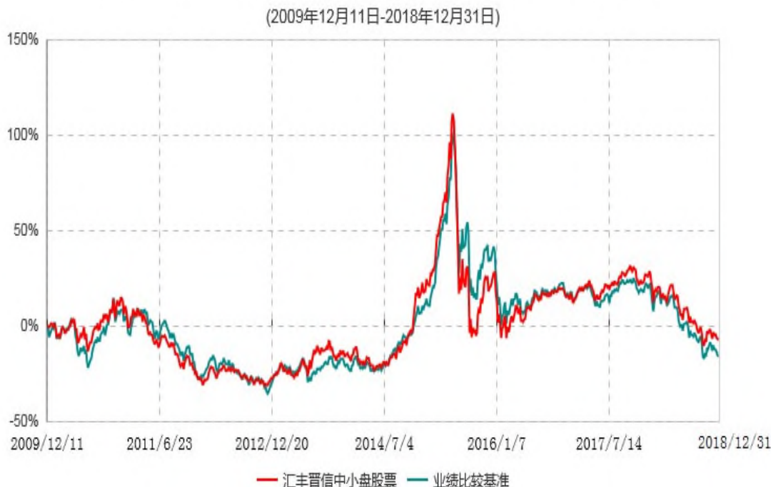
汇丰晋信中小盘股票型证券投资基金累计净值增长率与业绩比较基准收益率历史走势对比图