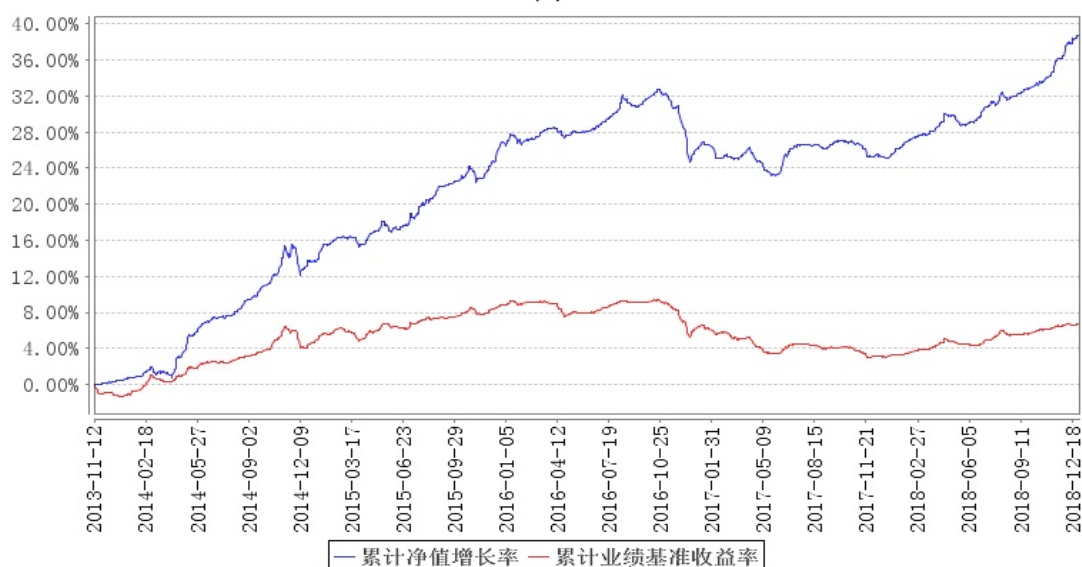
南方丰元信用增强债券A累计净值增长率与同期业绩比较基准收益率的历史走势对比图