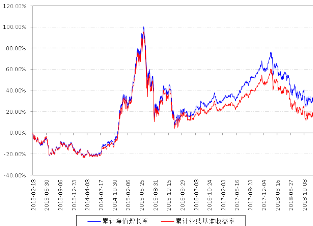
南方开元沪深300ETF累计净值增长率与同期业绩比较基准收益率的历史走势对比图