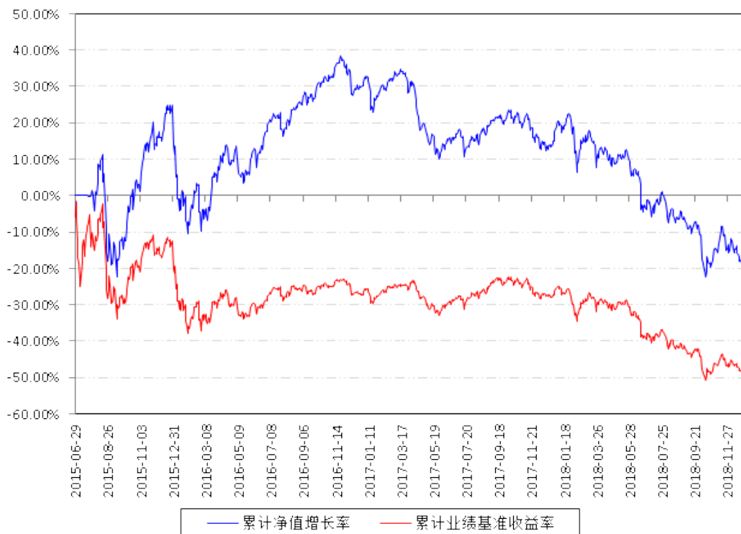
南方量化成长股票累计净值增长率与同期业绩比较基准收益率的历史走势对比图