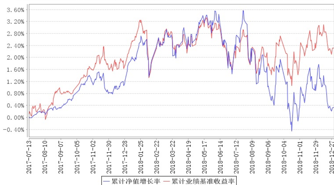
南方安睿混合累计净值增长率与同期业绩比较基准收益率的历史走势对比图

注:本基金的基金合同生效日为 2017 年 7 月 13 日,本基金建仓期为 6 个月,建仓期结束时各项资产配置比例符合合同约定。