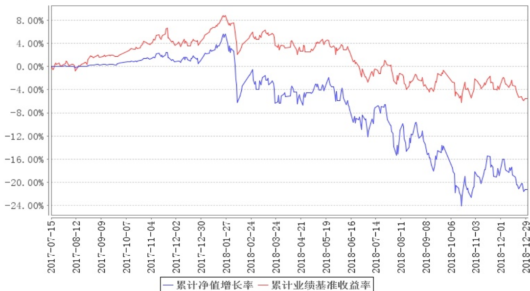
南方平衡配置混合累计净值增长率与同期业绩比较基准收益率的历史走势对比图