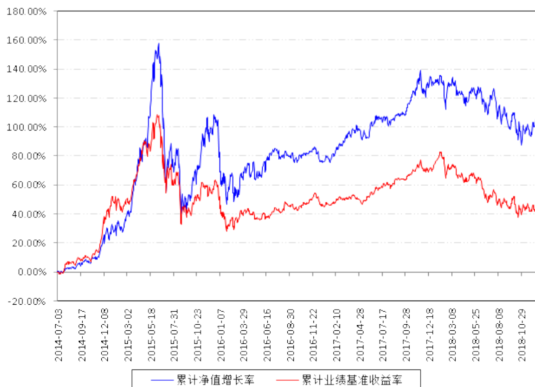
南方天元新产业股票累计净值增长率与同期业绩比较基准收益率的历史走势对比图