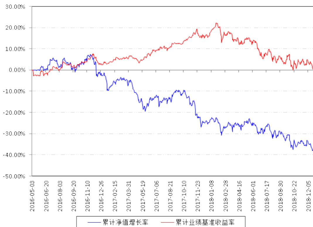
南方新兴龙头灵活配置混合累计净值增长率与同期业绩比较基准收益率的历史走势对比图