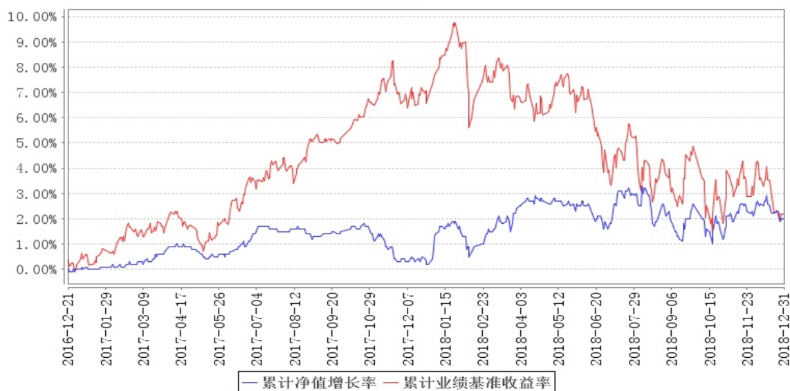
南方睿见定期开放混合发起累计净值增长率与同期业绩比较基准收益率的历史走势对比图