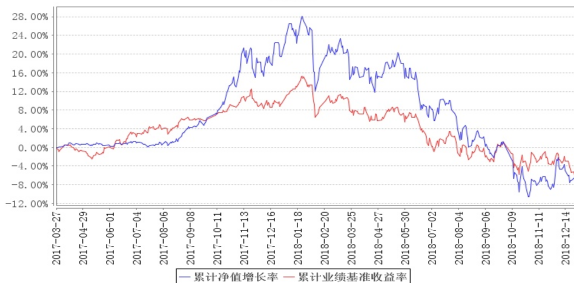
南方智慧精选灵活配置混合累计净值增长率与同期业绩比较基准收益率的历史走势对比图