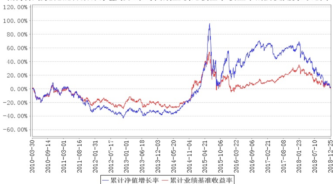
南方策略优化混合累计净值增长率与同期业绩比较基准收益率的历史走势对比图