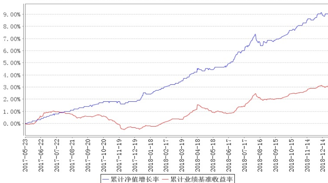
南方纯元A累计净值增长率与同期业绩比较基准收益率的历史走势对比图