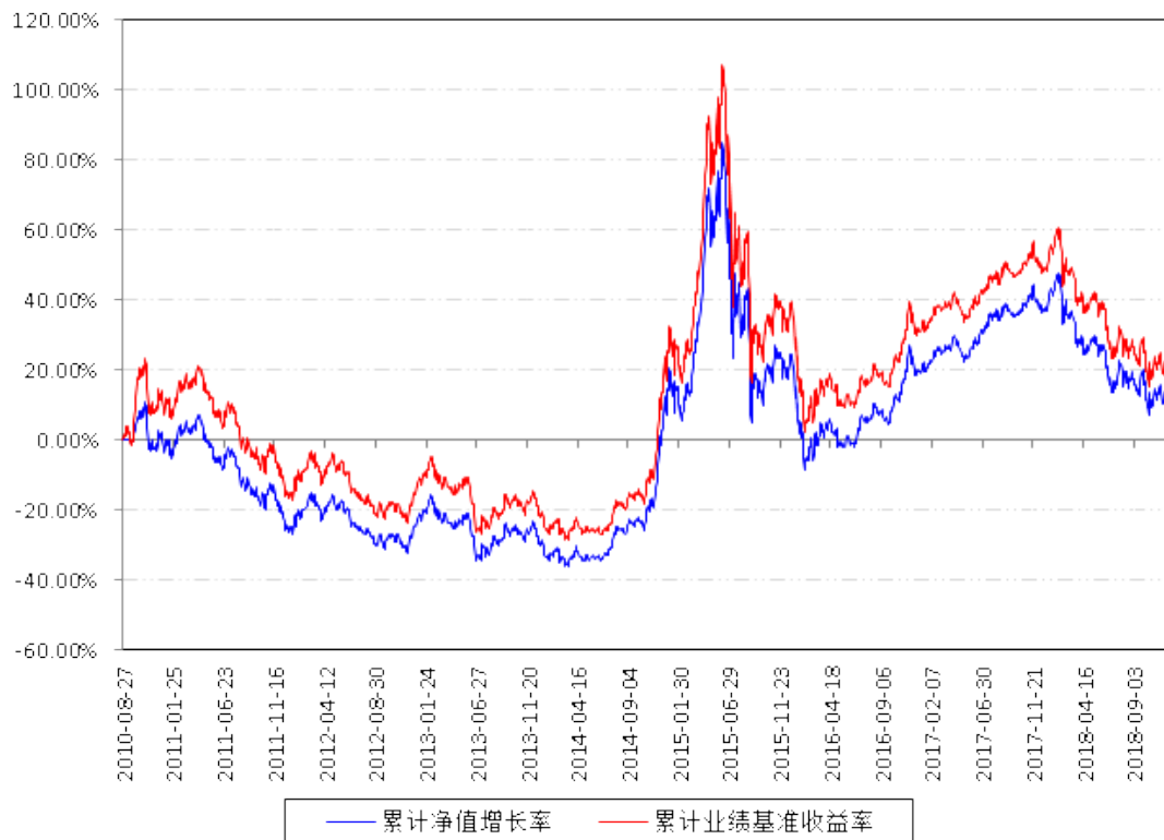
南方小康A累计净值增长率与同期业绩比较基准收益率的历史走势对比图