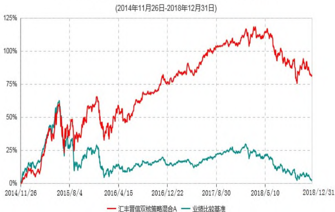
汇丰晋信双核策略混合A累计净值增长率与业绩比较基准收益率历史走势对比图