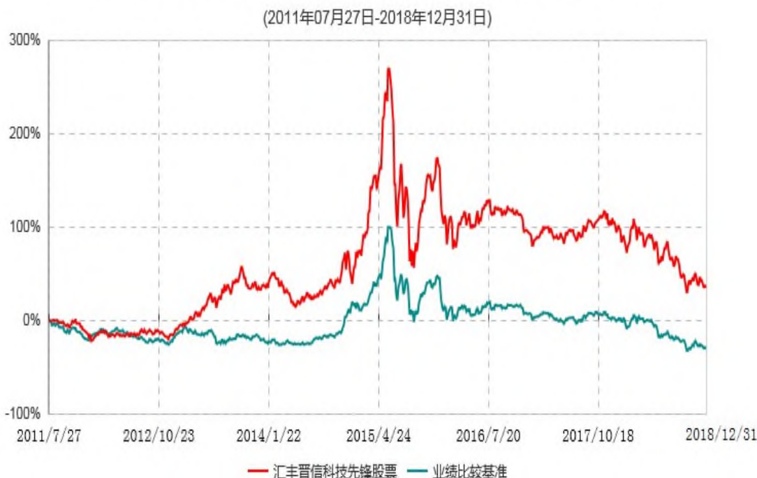
汇丰晋信科技先锋股票型证券投资基金累计净值增长率与业绩比较基准收益率历史走势对比图