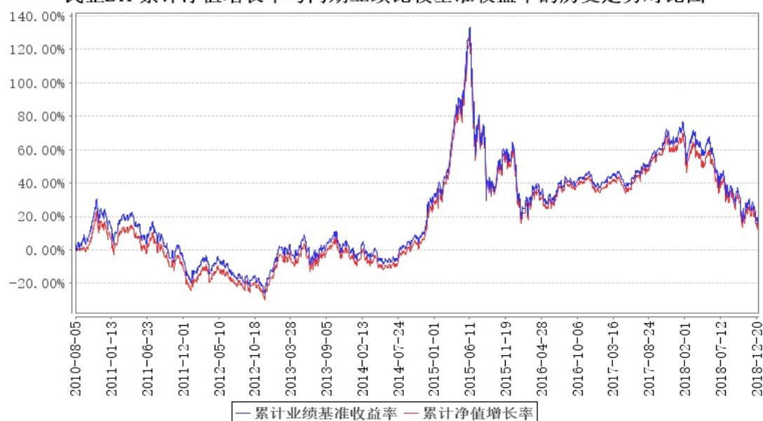
民企ETF累计净值增长率与同期业绩比较基准收益率的历史走势对比图