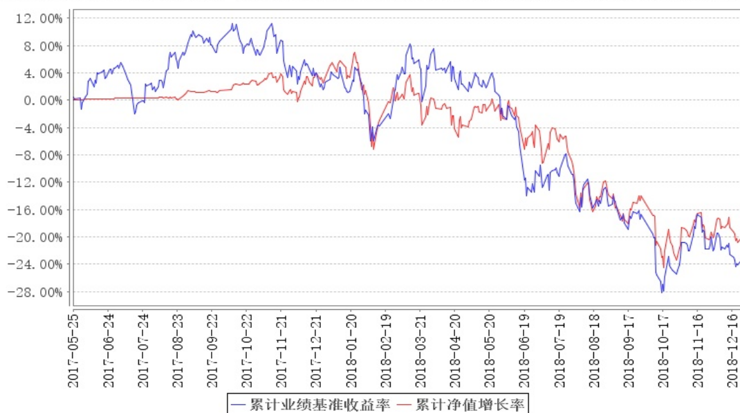
鹏华新科技传媒混合累计净值增长率与同期业绩比较基准收益率的历史走势对比图