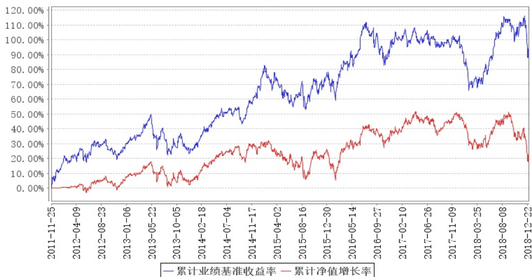
鹏华美国房地产 (QDII) 累计净值增长率与同期业绩比较基准收益率的历史走势对比图