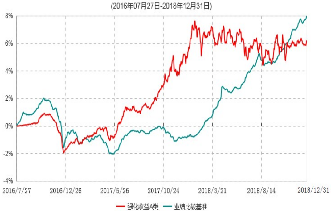
强化收益A类累计净值增长率与业绩比较基准收益率历史走势对比图