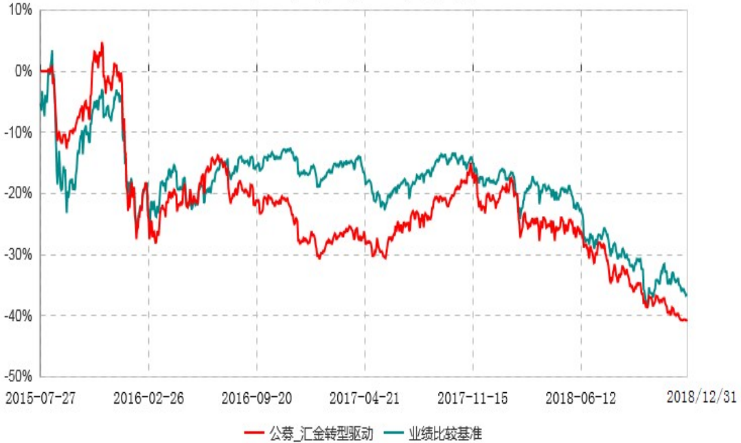
浙商汇金转型驱动灵活配置混合型证券投资基金累计净值增长率与业绩比较基准收益率历史走势对比图 (2015年07月27日-2018年12月31日)