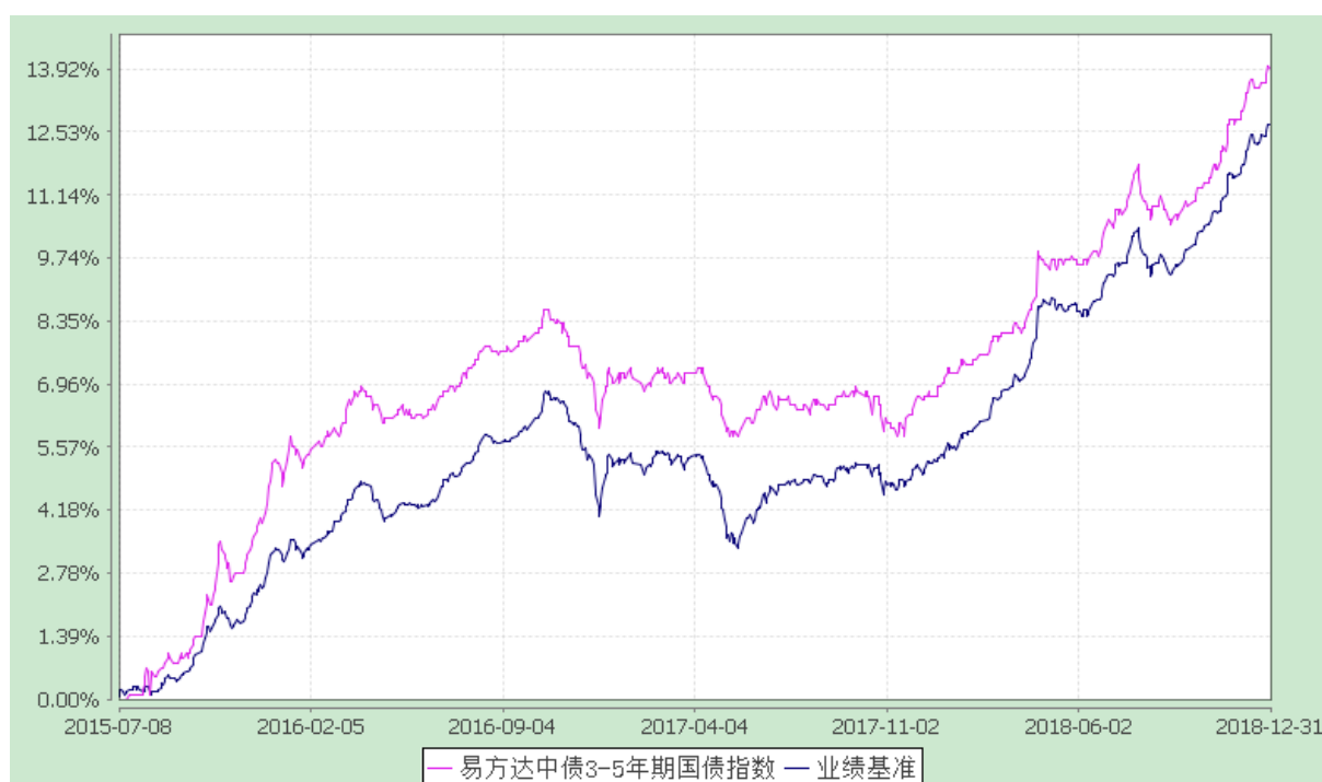
易方达中债 3-5 年期国债指数证券投资基金 份额累计净值增长率与业绩比较基准收益率历史走势对比图 (2015 年 7 月 8 日至 2018 年 12 月 31 日)

注：自基金合同生效至报告期末，基金份额净值增长率为 13.90%，同期业绩比较基准收益率为 12.69%。