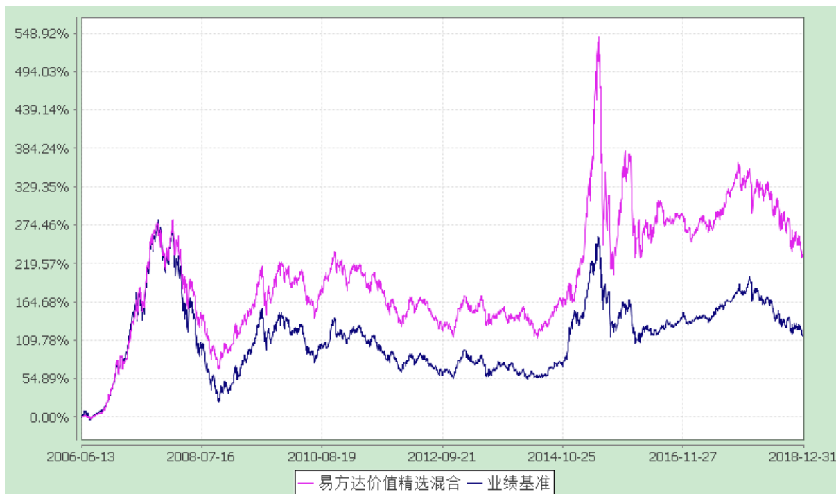
易方达价值精选混合型证券投资基金 份额累计净值增长率与业绩比较基准收益率历史走势对比图 (2006年6月13日至2018年12月31日)

注：自基金合同生效至报告期末，基金份额净值增长率为 231.20%，同期业绩比较基准收益率为 116.60%。