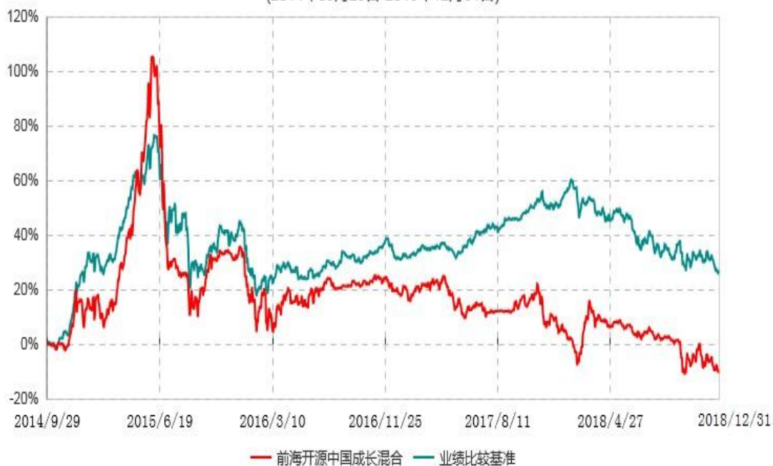
前海开源中国成长灵活配置混合型证券投资基金累计净值增长率与业绩比较基准收益率历史走势对比图 (2014年09月29日-2018年12月31日)