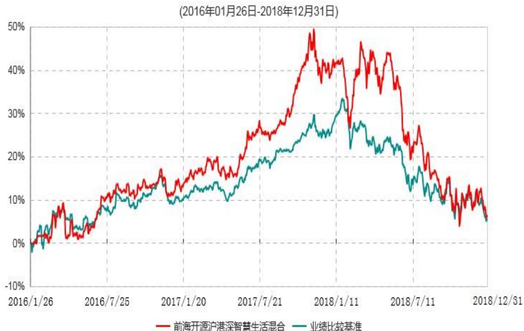
前海开源沪港深智慧生活优选灵活配置混合型证券投资基金累计净值增长率与业绩比较基准收益率历史走势对比图